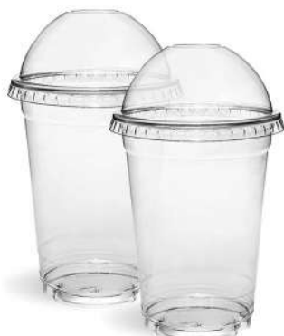
Copo Pet PTC09 Alimentos 270mL 20x50 - PT Ref.: 12528