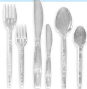
Garfo Sobremesa Plastilândia c/ 1000 - CX Ref.: 10644